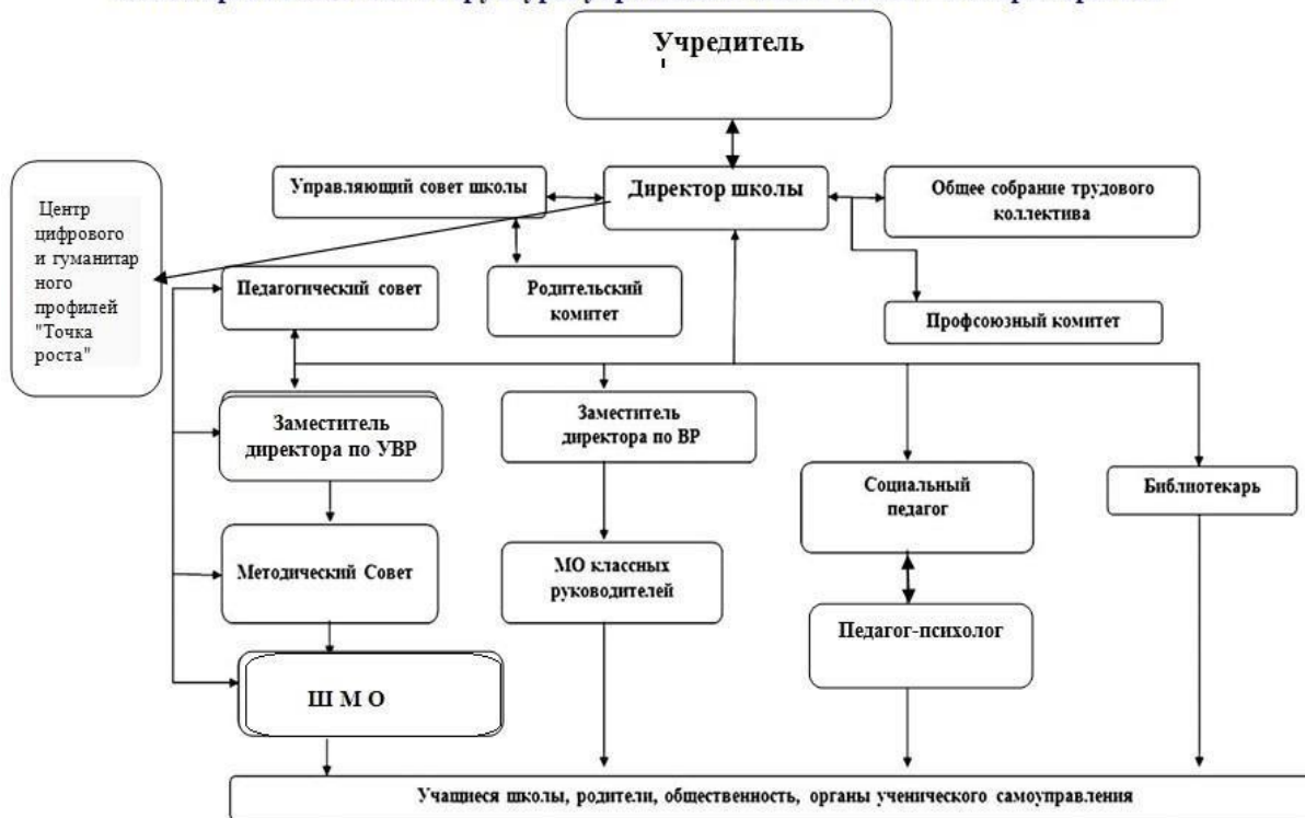
Схема организационной структуры управления МКОУ СОШ 7 с Старомарьевка

Управленческая деятельность администрации школы направлена на достижение эффективности и качества образовательного процесса, на реализацию целей образования.