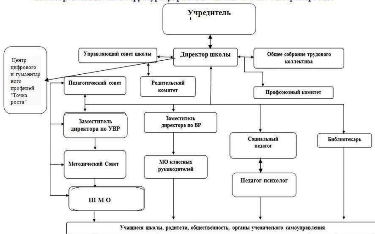
Схема организационной структуры управления МКОУ СОШ 7 с Старомарьевка

Управленческая деятельность администрации школы направлена на достижение эффективности и качества образовательного процесса, на реализацию целей образования.